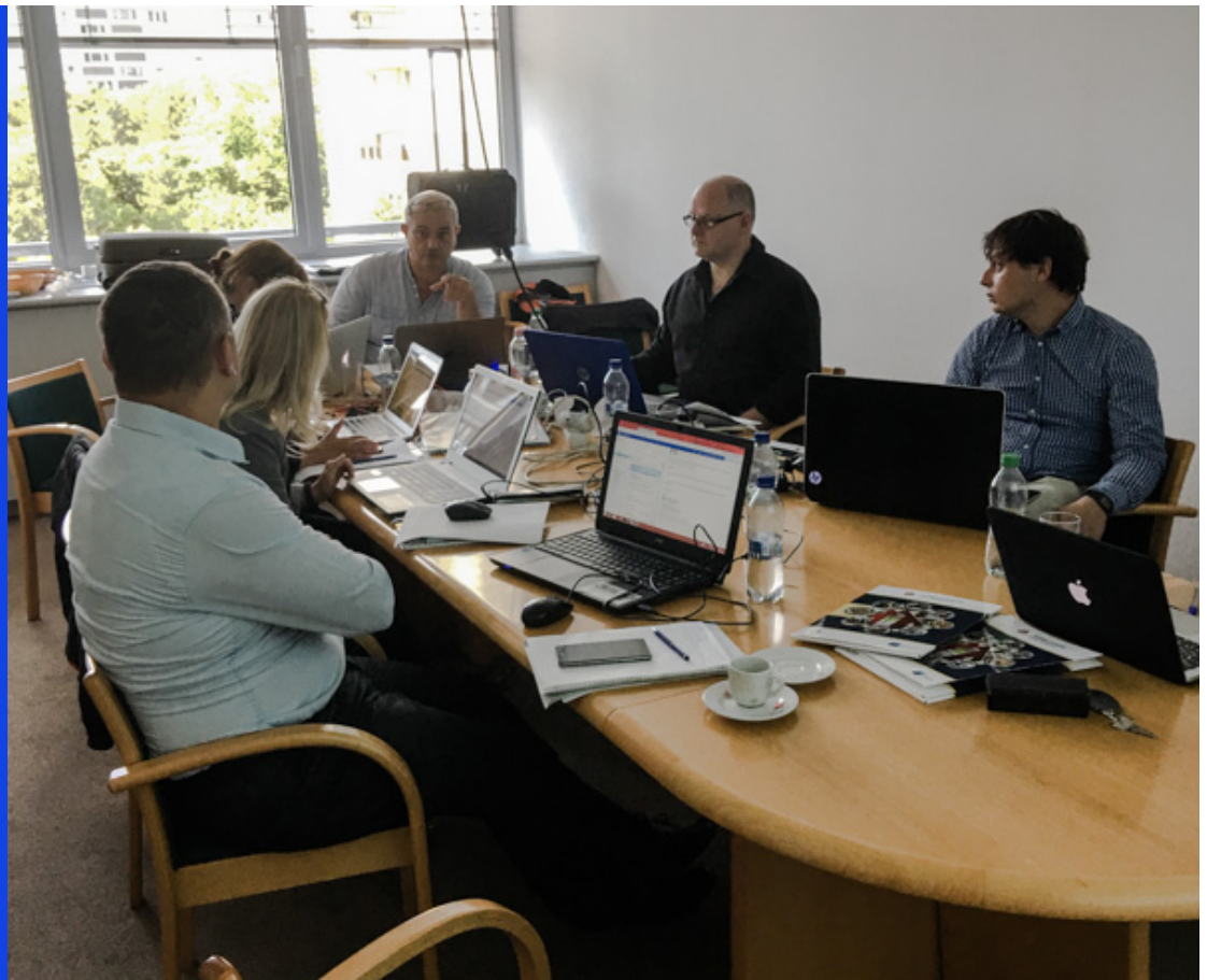
Laatste projectbijeenkomst in Boedapest, op 17 september